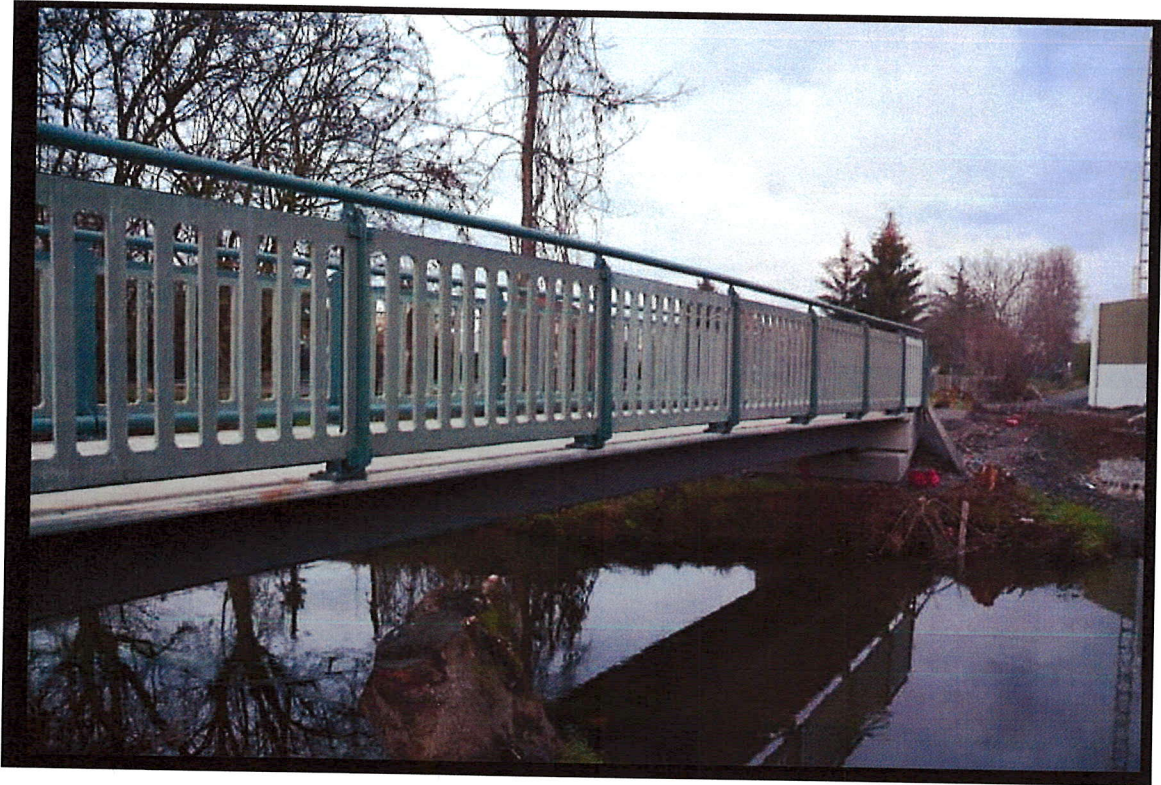
Obr. 4 Přímá betonová lávka