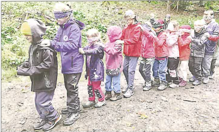
NA ŠUMAVĚ. Zadnotřebská školáci na adaptačním kursu v Zelené Lhotě.

Jeli jsme vlakem a i přes dva přestupy děti zvládly cestu bez potíží. Již na cestu jsme byli rozděleni do sedmi týmů, symbolicky pojmenovaných podle evropských zemí. Během jízdy jsme luštili, poznávali informace o spolužácích a povídali si. Po příjezdu do Hamru – Hojsovy Stráže jsme se vydali pěšky po turistických cestách směrem na Zelenou Lhotu, tedy na cestu dlouhou okolo 9 km. Počasí bylo typicky podzimní – mlhavo a kolem deseti stupňů. Déšť nás však zastihl až těsně u hotelu - bez přestávky pak vydrželo pršet až do ranních hodin druhého dne. První večer jsme tedy strávili v hotelu, kde se odehrála poznávací bojovka. (Dokončení na str. 6) (box)