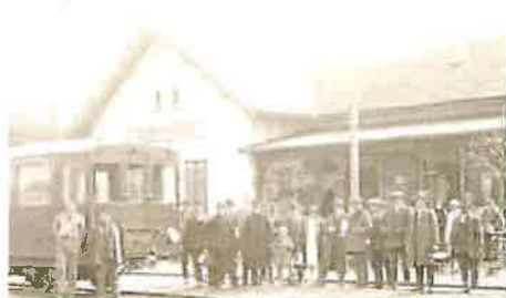
KDYSL. Zadnotřebské nádraží na historické fotografii.

svým potomkům předávat a učit je ctít nejen naše rodinné dědictví. Žádám Vás, abyste upustili od plánů na demolici a místo toho se zasadili o revitalizaci stávající nádražní budovy, která bude spojovat historické hodnoty s potřebami dnešní doby. (Dokončení na straně 6)