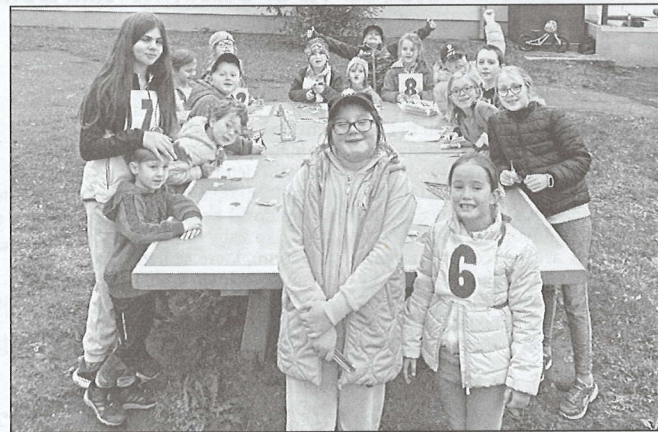
Hasičská bojovka na zahradě trebaňské školy.